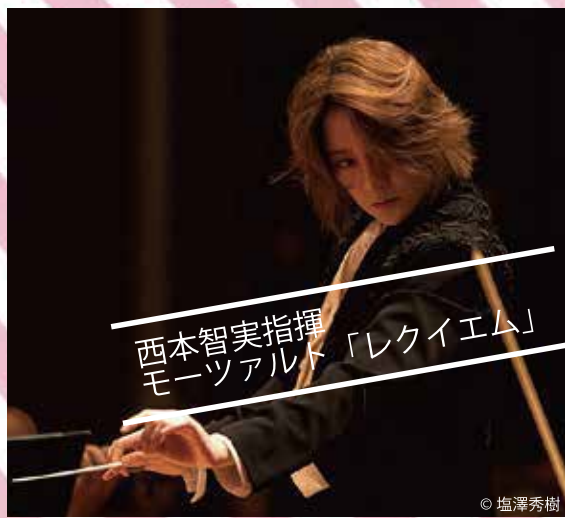
西本智実指揮 モーツァルト「レクイエム」