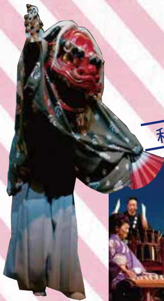
和楽器演奏集団独楽(こま)