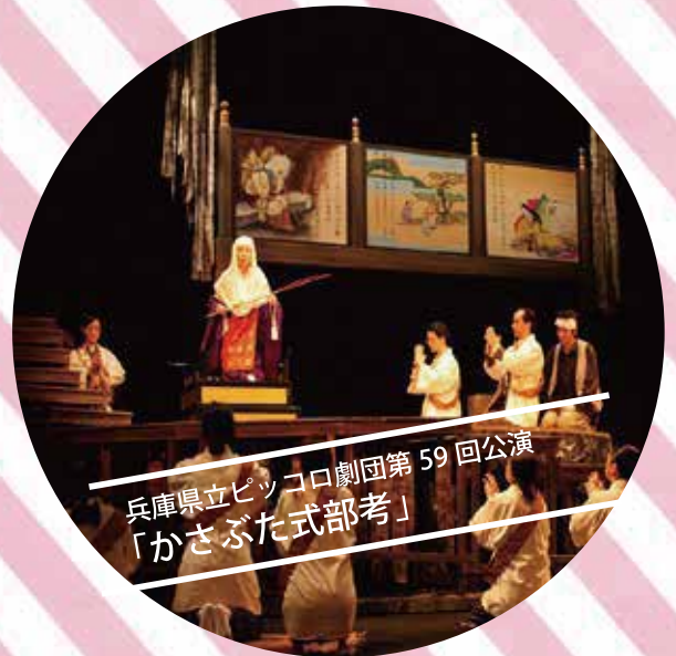
兵庫県立ピッコロ劇団第59回公演 「かさぶた式部考」