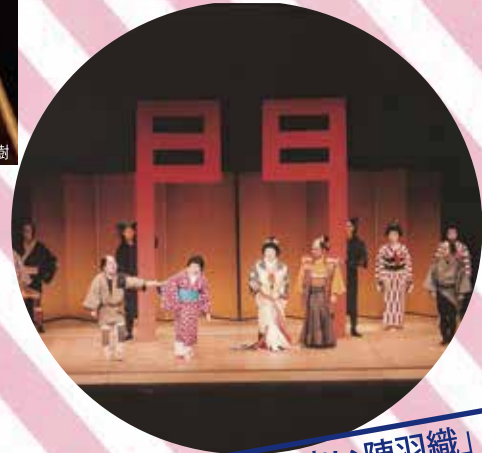
関西歌劇団オペラ「白狐の湯」「赤い陣羽織」