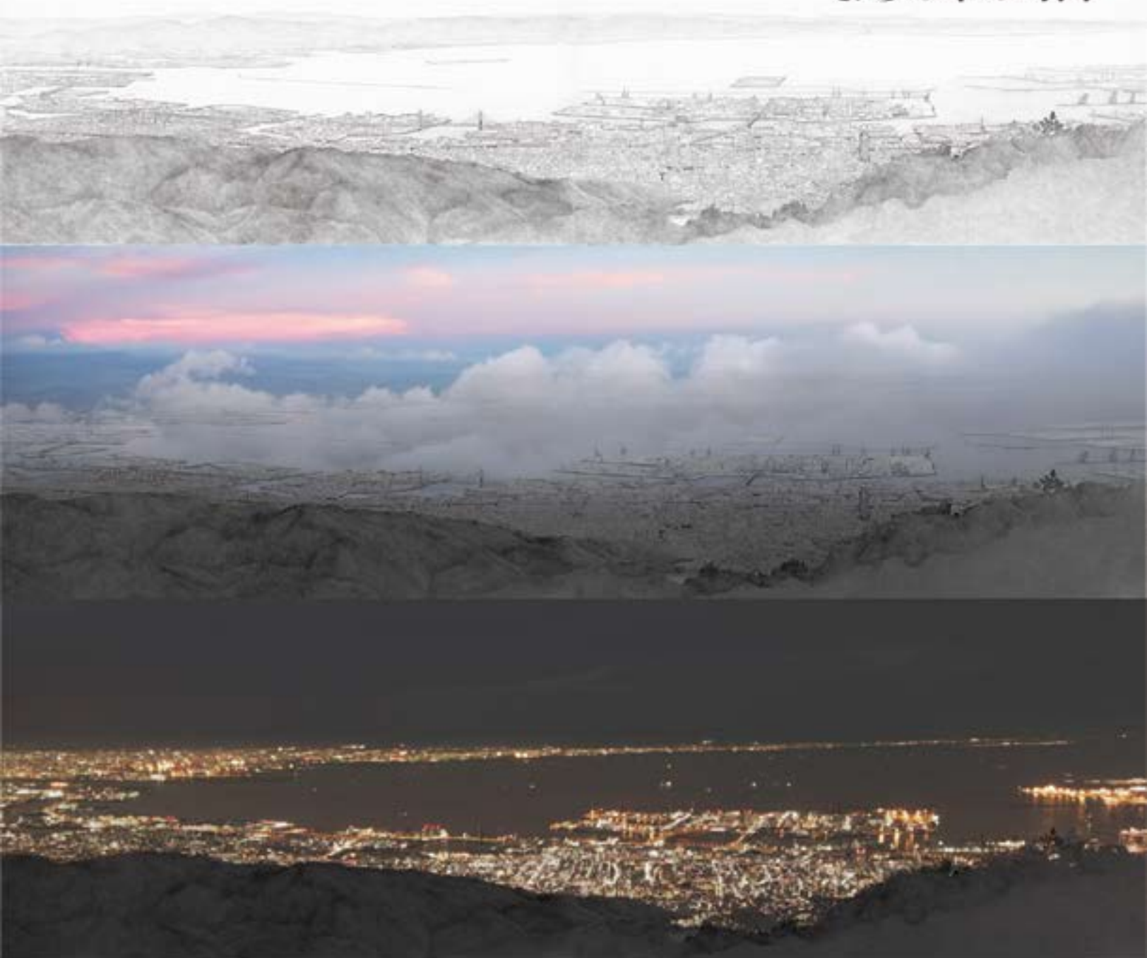
ヤマガミ ユキヒロ「六甲の眺望」(2013) carvan projection size: 380cm x 120cm duration: 657